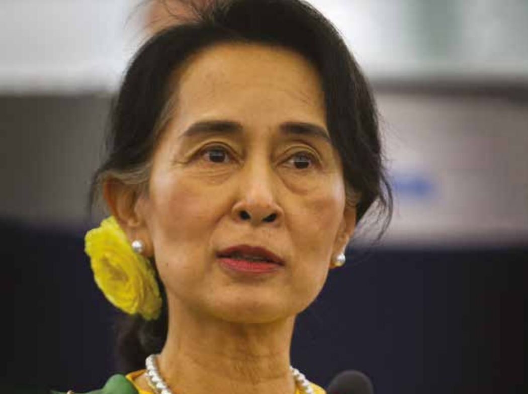
Veranderlijke morele oordelen: Aung San Suu Kyi