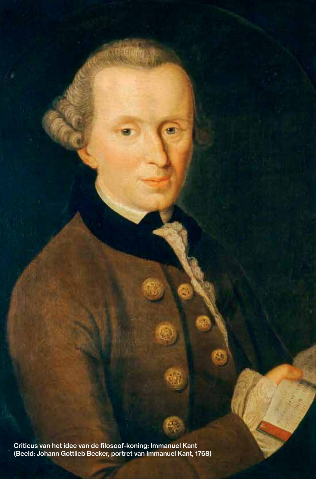
Criticus van het idee van de filosoof-koning: Immanuel Kant (Beeld: Johann Gottlieb Becker, portret van Immanuel Kant, 1768)